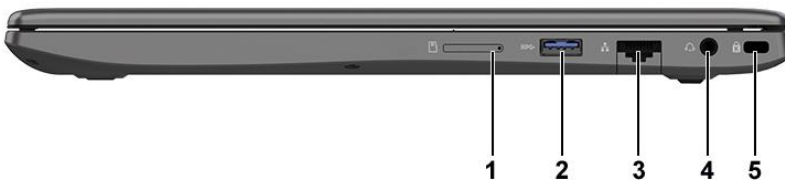
Рисунок 2. Вид ноутбука слева

1 — слот для карты microSD; 2 — USB 3.2; 3 — разъем RJ45; 4 — комбинированный аудиоразъем; 5 — гнездо для клиновидного замка Kensington